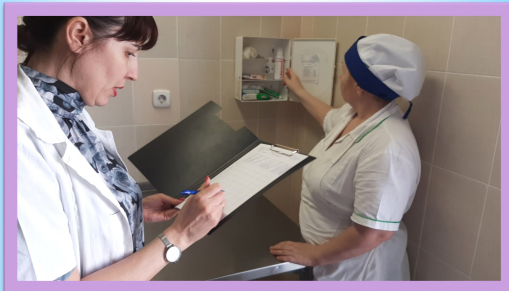
Инспектирование рабочих мест сотрудников